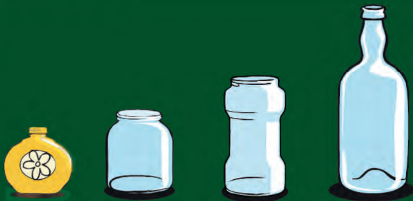
Botellas de vidrio, frascos y tarros