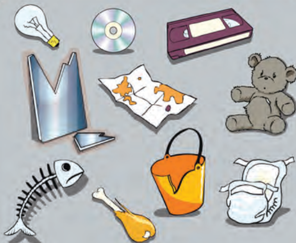
Restos de comida, pañales, bombillas, cd's, juguetes rotos, cintas de vídeo...