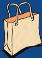
Periódicos, libros, revistas y bolsas de papel