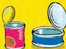
Latas de conserva