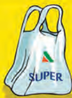
Bolsas de plástico de comercio