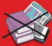
Libros y diarios